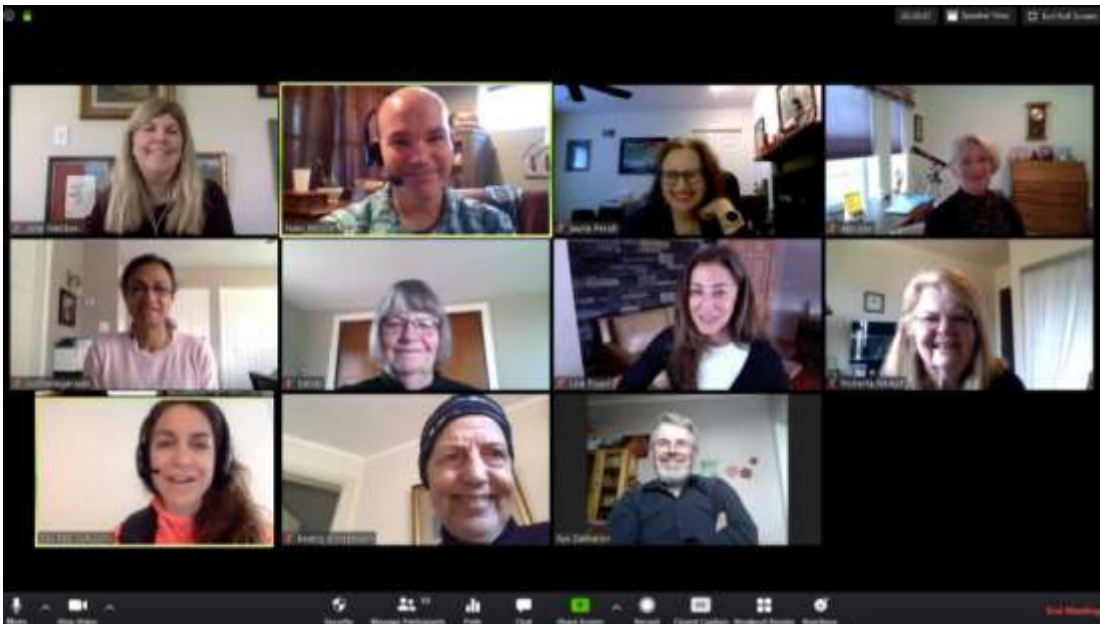
IAC CPRT Group Photo!